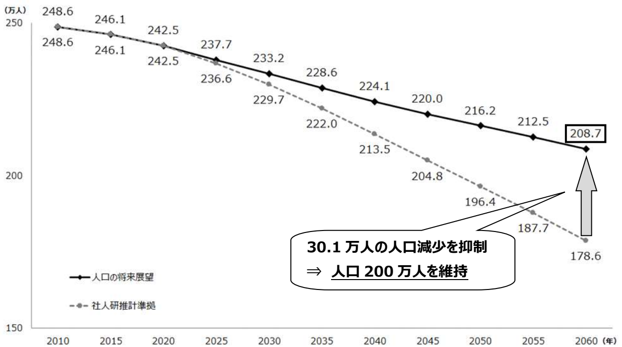
〔図表Ⅱ 広島広域都市圏の人口の将来展望〕